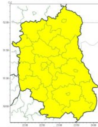
Burze z gradem

Instytut Meteorologii i Gospodarki Wodnej - Państwowy Instytut Badawczy Centralne Biuro Prognoz Meteorologicznych - Wydział w Warszawie 01-673 Warszawa ul. Podleśna 61 tel: 22 5694151, kom. 781774153, fax: 022-5694151 email: meteo.warszawa@imgw.pl www: www.imgw.pl