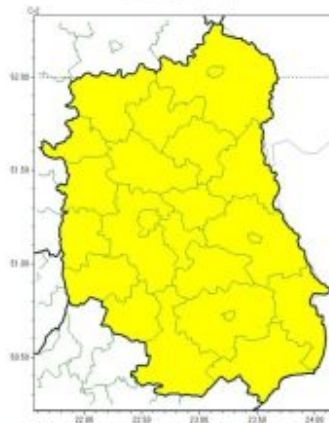
Burze z gradem