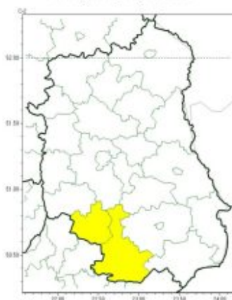
Intensywne opady deszczu