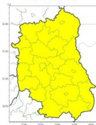
Intensywne opady śniegu