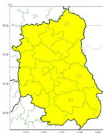
Intensywne opady deszczu

Instytut Meteorologii i Gospodarki Wodnej - Państwowy Instytut Badawczy Centralne Biuro Prognoz Meteorologicznych w Warszawie 01-673 Warszawa ul. Podleśna 61 tel: 22-5694150, fax: 22-8345097 email: synoptyk.kraju@imgw.pl www: www.imgw.pl