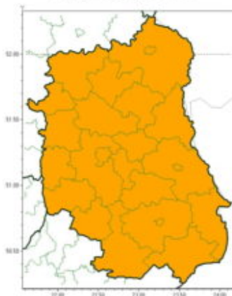
Intensywne opady deszczu

51-616 Wrocław ul. Parkowa 30 tel: 071-320-01-50, fax: 071-348-73-37 email: meteo.wroclaw@imgw.pl www: www.imgw.pl