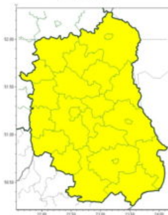
Burze z gradem

Instytut Meteorologii i Gospodarki Wodnej - Państwowy Instytut Badawczy Centralne Biuro Prognoz Meteorologicznych - Wydział w Warszawie 01-673 Warszawa ul. Podleśna 61 tel: 22 5694151, kom. 781774153, fax: 022-5694151 email: meteo.warszawa@imgw.pl www: www.imgw.pl