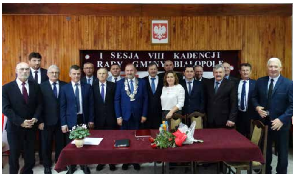
Rada Gminy VIII Kadencji 2018 – 2024