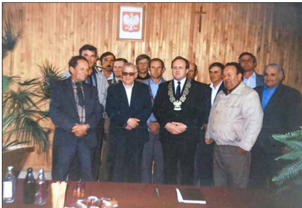
Rada Gminy I kadencji 1990 – 1994