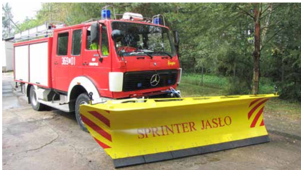
Mercedes Pożarniczy wyposażony w drugi pług do odśnieżania, zakup w 2014 r.

W latach 2011 – 2014 na terenie gminy zrealizowano inwestycje za kwotę 4mln 443,3 tys. zł, w tym: