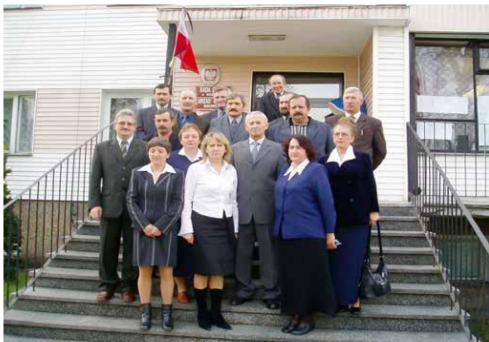
Rada Gminy V Kadencji 2006 – 2010