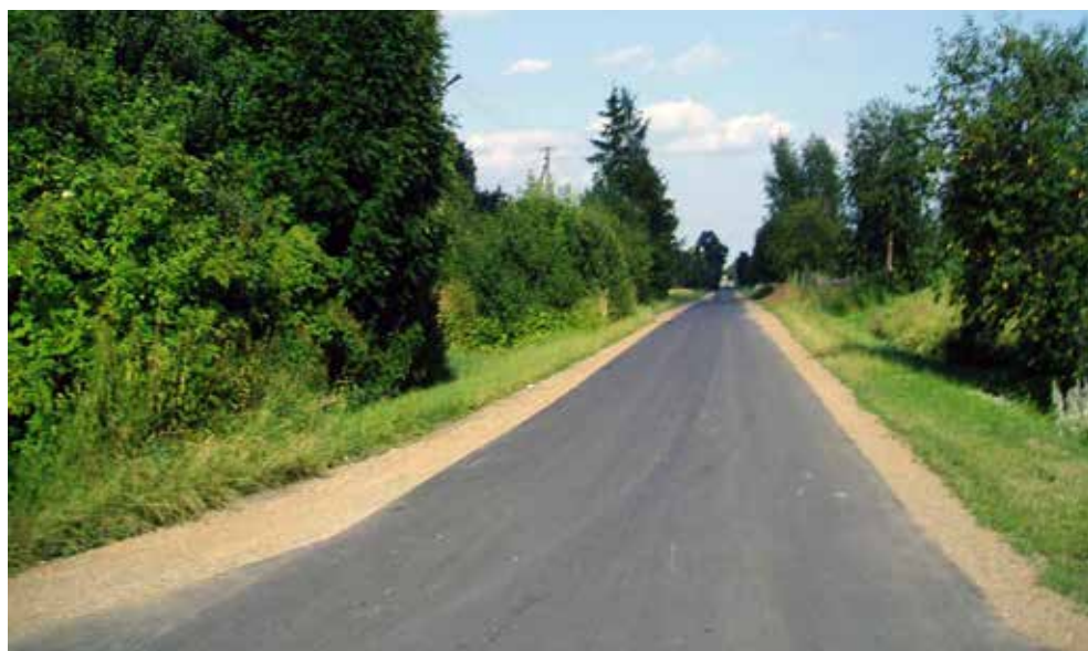
Zmodernizowana droga w Strzelcach, 2008 r.

Asfalt został położony w Buśnie i Białopolu na odcinku ponad 1 km. Wspólnie z Powiatem Chełmskim zmodernizowano 2,3 km dróg powiatowych w Teremcu i Kurmanowie.