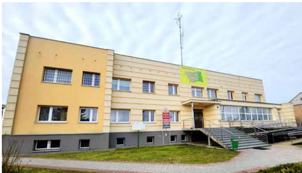
Termomodernizacja budynku Urzędu Gminy, 2018 r.