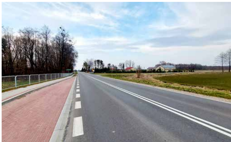
Wybudowany chodnik oraz zmodernizowana droga wojewódzka w Raciborowicach

Kwotę 848,4 tys. zł wydatkowano na budowę chodników przy drodze wojewódzkiej 1.595 m w Raciborowicach,