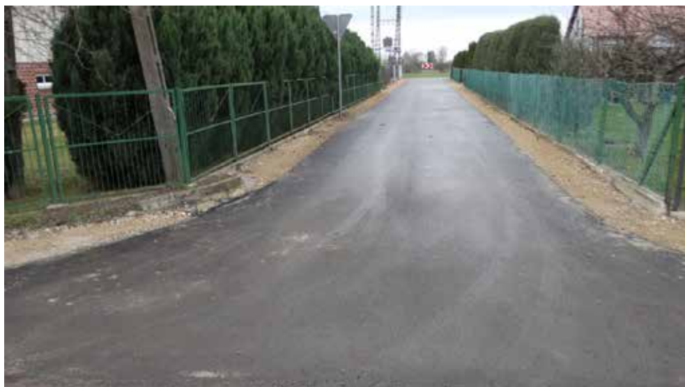
Zmodernizowane drogi na Osiedlu w Białopolu

W 2019 roku gmina kontynuowała modernizację dróg gminnych, 1,8 km wybudowano w Białopolu, Raciborowicach i Raciborowicach – Kolonii oraz 1 km drogi powiatowej w Teremcu. Na inwestycje drogowe wydatkowano ponad 1mln 119 tys. zł, w tym z budżetu gminy ponad 423,4 tys. zł,