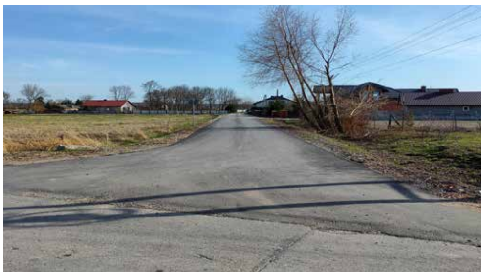
Zmodernizowana w ramach zagospodarowania poscaleniowego droga w Buśnie