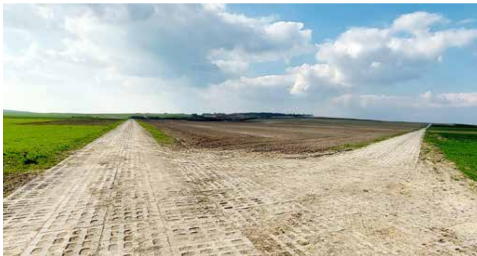
Zmodernizowane w ramach zagospodarowania poscaleniowego drogi w Buśnie