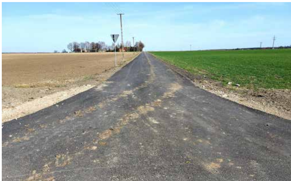
Zmodernizowana w ramach zagospodarowania poscieniowego droga gminna w Strzelcach - Kolonii

Samorząd Województwa Lubelskiego w 2021 roku na odcinku Raciborowice – Białopole przebudował ponad 4 km drogi wojewódzkiej za kwotę 2 mln 180 tys. zł.