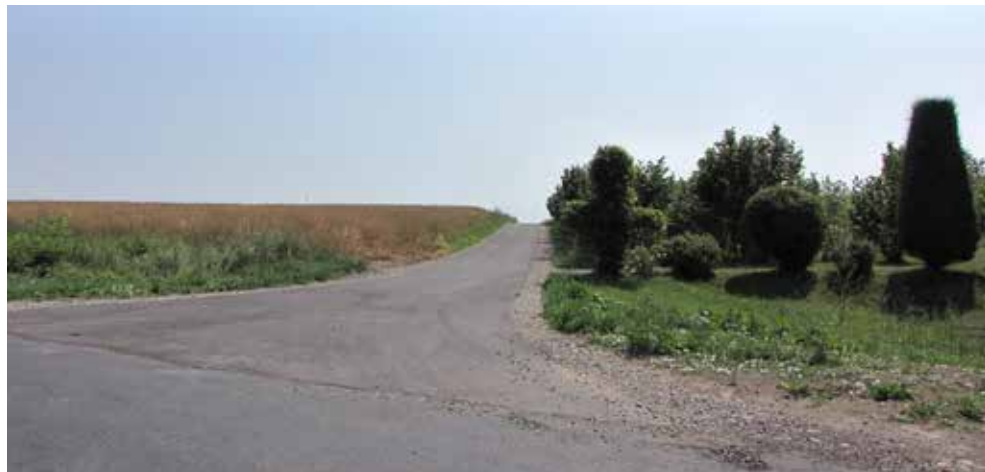
Przebudowana droga w Raciborowicach w 2017 r.

w tym 2,5 km dróg powiatowych w Buśnie i w Kurmanowie oraz 3,5 km dróg gminnych w Horeszkowicach, Raciborowicach, Strzelcach i Teresinie.