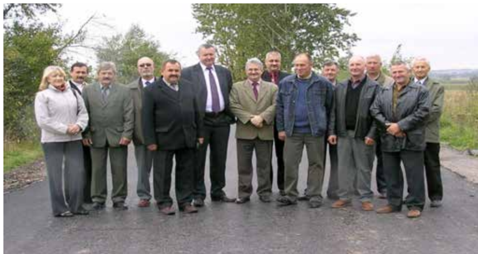
Odbiór zmodernizowanej drogi powiatowej Strzelce - Teremiec, 1.10.2009 r.

Asfalt został położony w Buśnie i Białopolu na odcinku ponad 1 km. Wspólnie z Powiatem Chełmskim zmodernizowano 2,3 km dróg powiatowych w Teremcu i Kurmanowie.