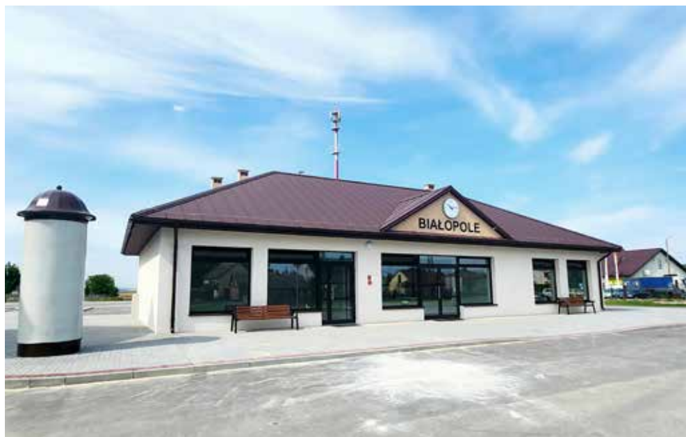
Odnowione centrum Białopola