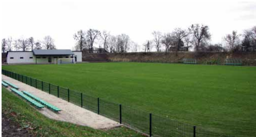
Zmodernizowany stadion w Białopolu