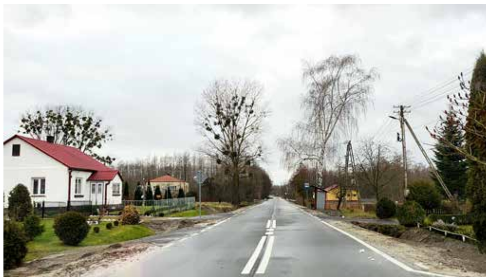
Zmodernizowana droga powiatowa Raciborowice Kolonia – Kułakowice III

W następnym 2024 roku władze gminy nie spoczęły na laurach, wspólnie z powiatem zaplanowano inwestycje o wartości 11 mln 957,3 tys. zł. Na sfinansowanie zaplanowanych zadań już pozyskano środki zewnętrzne z PROW oraz z Rządowego Funduszu Polski Ład w wysokości 8 mln 972,3 tys. zł.