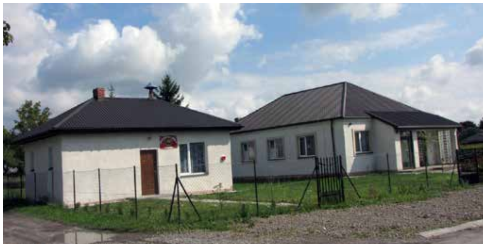
Zmodernizowana świetlica w Teresinie, 2012 r.

ponad 1 km, w Strzelcach (Podlesie) 1 km oraz w Białopolu ponad 400 m (ul. Polna oraz ul. Kościelna), zmodernizowano świetlice w Kicinie, Raciborowicach, Kurmanowie oraz budynek po sklepie dla OSP Teresin. Wyremontowano systemem gospodarczym 2 mosty na rzece Wełnianka w Busieńcu i Kicinie.