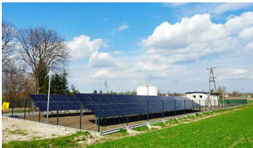
Zmodernizowane ujęcie wody w Białopole