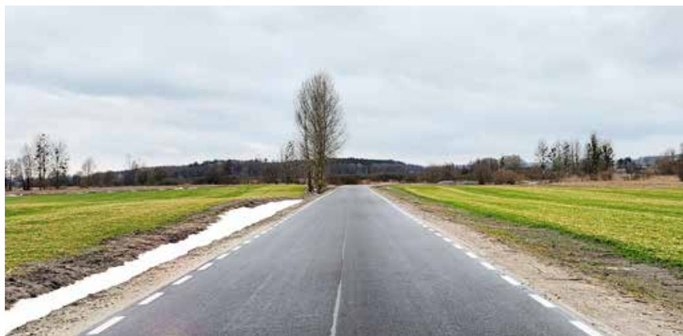
Zmodernizowana droga powiatowa Kurmanów – Bušno

W następnym 2024 roku władze gminy nie spoczęły na laurach, wspólnie z powiatem zaplanowano inwestycje o wartości 11 mln 957,3 tys. zł. Na sfinansowanie zaplanowanych zadań już pozyskano środki zewnętrzne z PROW oraz z Rządowego Funduszu Polski Ład w wysokości 8 mln 972,3 tys. zł.