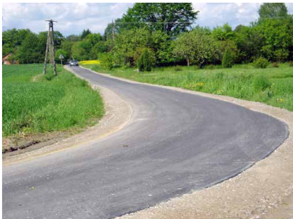
Zmodernizowana droga w Raciborowicach Kolonii - Karolicha

W tym roku gmina sfinansowała dokumentację techniczną na dwa projekty. Jeden na przebudowę ponad 10 km dróg powiatowych na terenie gminy. Wartość projektu szacowana była na 4 mln, w przypadku zakwalifikowania zadania do dofinansowania koszty realizacji w 50% zabezpieczy budżet państwa, po 25% Powiat Chełmski i Gmina Białopole. Natomiast drugi projekt przygotowano na budowę sieci kanalizacyjnej i wodociągowej na osiedlu w Białopolu.