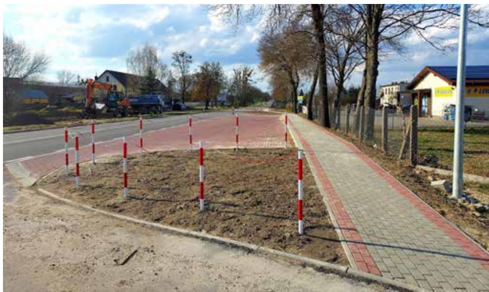
Wybudowany chodnik przy drodze wojewódzkiej w Buśnie