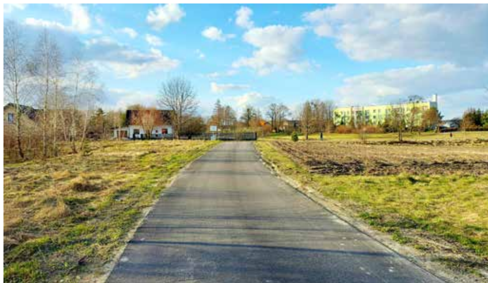
Wybudowana droga gminna w Kicinie

Za kwotę 262,8 tys. zł zostały wykonane projekty techniczne na przebudowę dróg gminnych, budowę infrastruktury sportowej przy Szkole Podstawowej w Białopolu, budowę sieci kanalizacyjnej ul. Polna w Białopolu oraz budowę i modernizację oświetlenia ulicznego, kwotę 55 tys. zł przeznaczono na utwardzenie 315 m drogi gminnej w Teresinie oraz 494,4 tys. zł na modernizację drogi gminnej w Kicinie na odcinku 480 m.