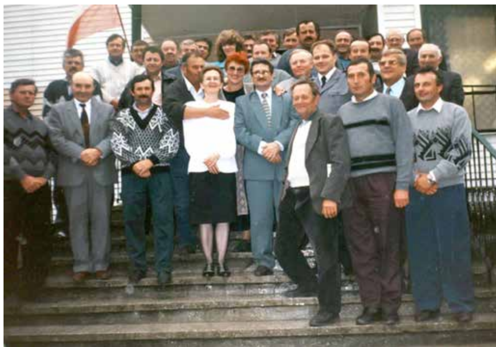
Samorząd II kadencji 1994 - 1998