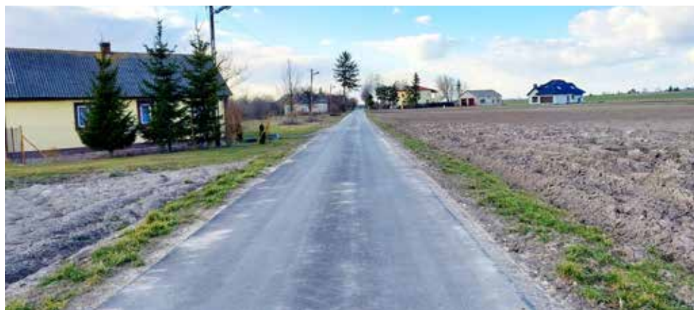
Zmodernizowana w ramach zagospodarowania posceniowego ul. Borowinowa w Białopolu

W 2022 roku był realizowany przez Powiat Chełmski ostatni etap projektu scalenia w 5 obrębach geodezyjnych (Białopole, Buśno, Kicin, Strzelce – Kolonia, Zabudnowo). Za kwotę 4 mln 777,4 tys. zł wybudowano lub przebudowano 8,8 km dróg gminnych.