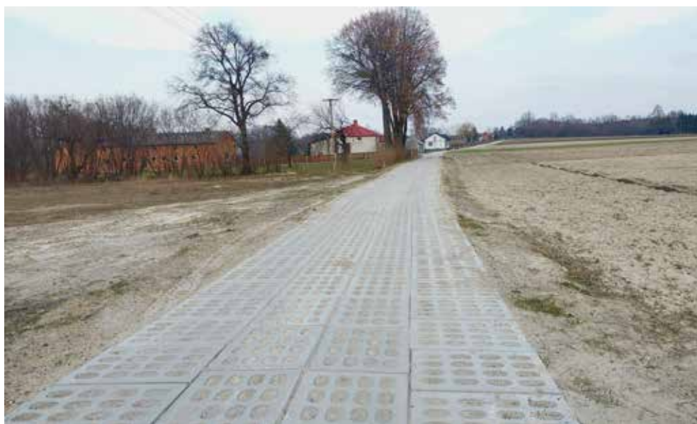
Wybudowana w ramach zagospodarowania poscaleniowego droga w Zabudnowie