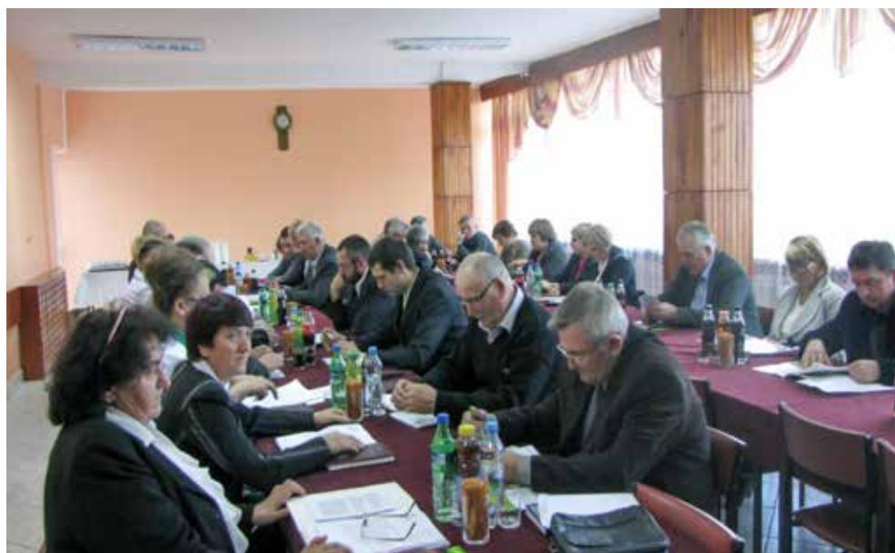
Obrady Rady Gminy VI Kadencji 2010 – 2014, 29.10.2013 r.