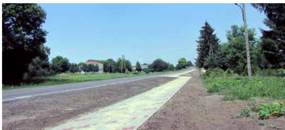
Wybudowany chodnik w Białopolu, 2017 r.

Na te zadania gmina pozyskała 766 tys. zł, w tym 416 tys. zł na drogi powiatowe z PROW, 50 tys. zł z Wojewódzkiego Funduszu Ochrony Gruntów Rolnych oraz 300 tys. zł z Województwa Lubelskiego na budowę 1,5 km chodników przy drodze wojewódzkiej w Białopolu i Raciborowicach. Ponadto wybudowano za środki własne 1,5 km sieci kanalizacyjnej oraz wodociągowej w Białopolu i Buśnie.