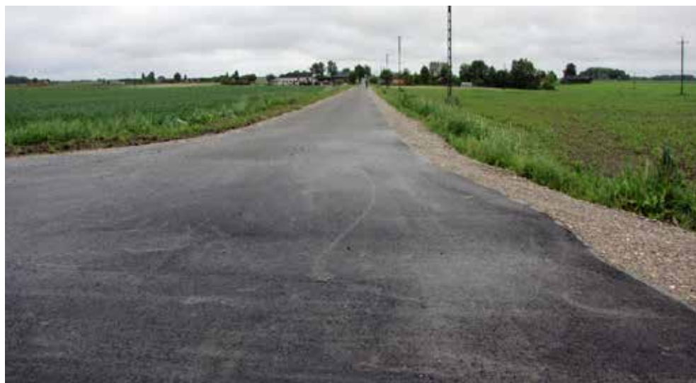
Zmodernizowana droga w Teremcu, 2015 r.

W 2015 roku gmina kontynuowała modernizację dróg gminnych. Za własne środki i pozyskane z Wojewódzkiego Funduszu Rekultywacji Gruntów Rolnych oraz Programu usuwania kłesk żywiołowych asfalt został położony w Teremcu na odcinku 0,9 km, w Strzelcach 0,5 km oraz w Białopolu ul. Targowa 0,2 km.