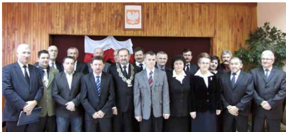
Rada Gminy VII Kadencji 2014 – 2018, 01.12.2014 r.