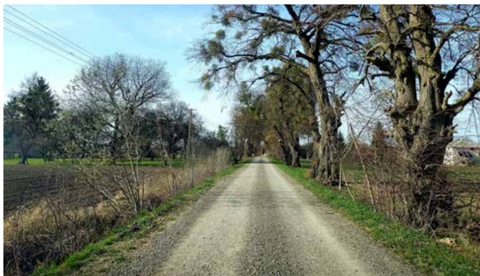
Zmodernizowana droga poscaleniowa w Teremcu