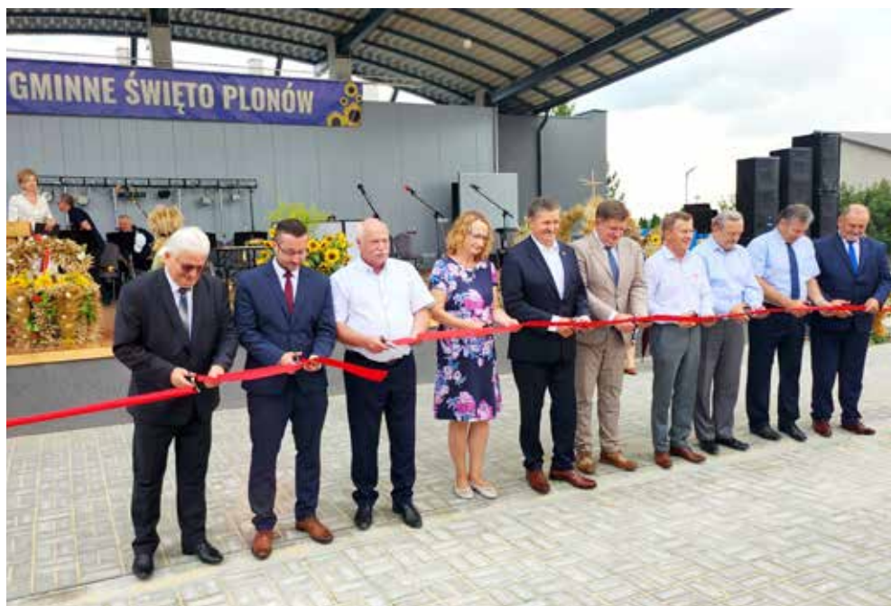
Uroczyste otwarcie amfiteatru podczas dożynek gminnych w 2023 r.