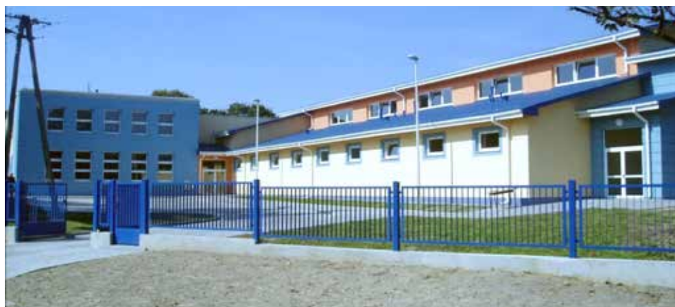
Nowa sala gimnastyczna i zmodernizowany budynek szkoły w Białopolu, 2006 r.

Dzięki tej inwestycji wszyscy uczniowie z terenu gminy mają bardzo dobre warunki do nauki, a także otrzymują gorący posiłek, bowiem przygotowane w nowej kuchni obiady są dowożone również do szkoły w Strzelcach.