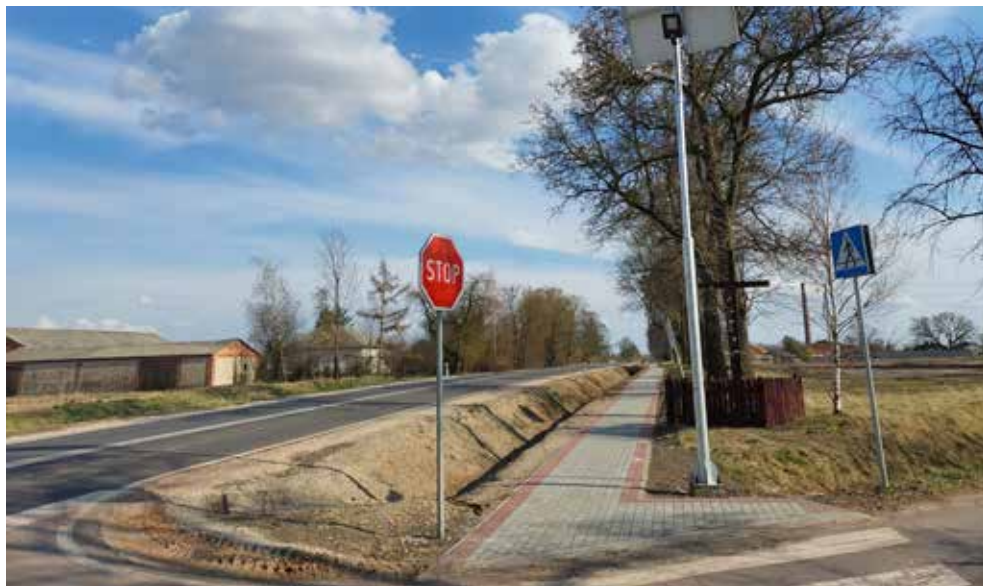
Wybudowany chodnik przy drodze wojewódzkiej w Białopole ul. Hrubieszowska

łopolu 1865 m i Buśnie 275 m, pozostała część zadania 1595 m została wykonana w 2022 roku.