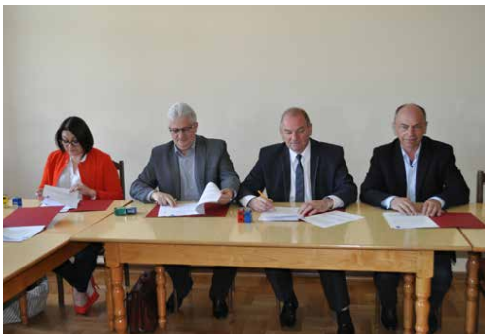
Wojślawice, 23.05.2018 r. podpisanie porozumienia w sprawie Klastra Energii Odnawialnej

Wspólnie z Powiatem Chełmskim wykonano modernizację 7,7 km dróg powiatowych w Raciborowicach, Strzelcach, Strzelcach – Kolonii i Teresinie. Przebudowano również 1,3 km dróg gminnych w Raciborowicach oraz w Białopolu ul. Kościuszki i ul. 3Maja. Ponadto zakupiono lekki samochód strażacki dla OSP Raciborowice – Kolonia. W trakcie roku budżetowego podpisano umowę i rozpoczęto realizację projektu „Zakup oraz montaż kolektorów słonecznych i pomp ciepła” za 1 mln 613 tys. zł. Projekt ten został zakończony i rozliczony w 2019 roku.