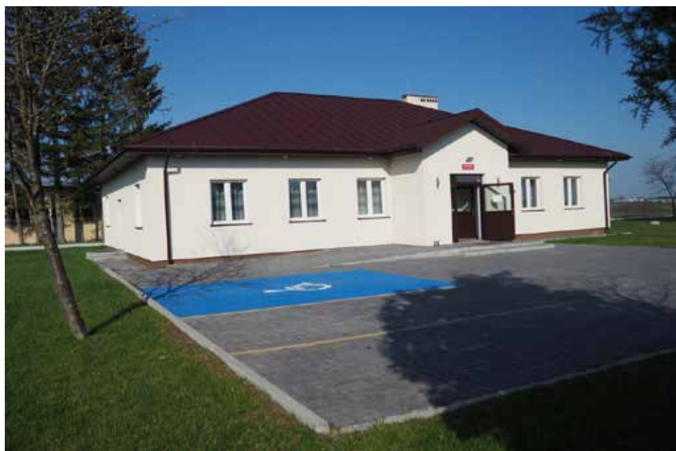
Wybudowana świetlica w Strzelcach-Kolonii

W tym roku Gmina Białopole we współpracy z Polską Izbą Energii Odnawialnej i Efektywnej Energetyki rozpoczęła prace przygotowawcze nad 2 projektami w zakresie Odnawialnych Źródeł Energii. Pierwszy dotyczy budowy małych farm fotowoltaicznych przy obiektach komunalnych. W I etapie wniosek będzie obejmował budowę małych farm dla oczyszczalni ścieków i ujęć wody w Białopolu i Raciborowicach. Drugi projekt o szerszym zasięgu w ramach budowy farmy fotowoltaicznej w Buśnie ma zapewnić ok. 1,7 MGW energii odnawialnej dla członków Spółdzielni Energetycznej z gmin Białopole, Dorohusk oraz Żmudź.