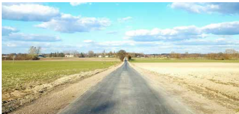
Zmodernizowana w ramach zagospodarowania posceniowego ul. Polna w Białopolu