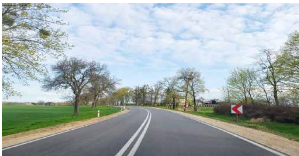
Przebudowana droga wojewódzka w Raciborowicach

Samorząd Województwa Lubelskiego w 2021 roku na odcinku Raciborowice – Białopole przebudował ponad 4 km drogi wojewódzkiej za kwotę 2 mln 180 tys. zł.