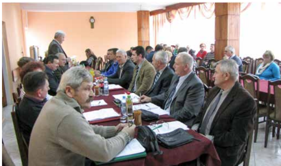
Obrady Rady Gminy VII Kadencji 2014 – 2018, 26.10.2015 r.