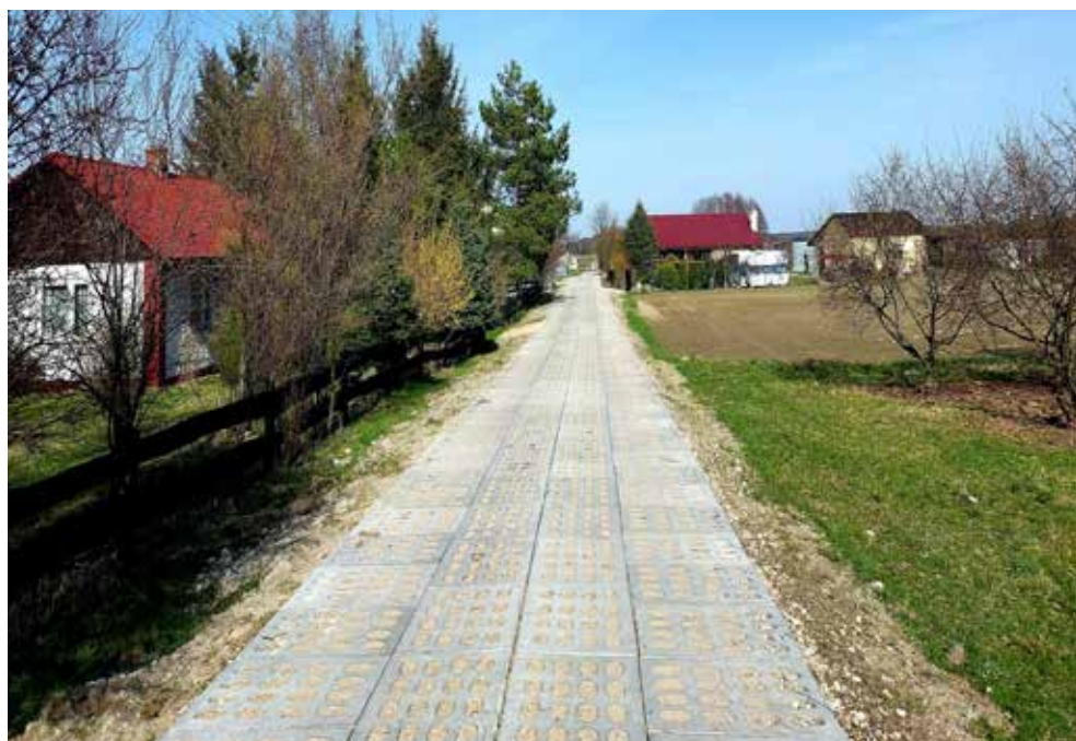
Zmodernizowana w ramach zagospodarowania poscaleniowego ul. Dębina w Białopolu