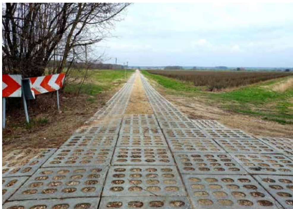
Zmodernizowana w ramach zagospodarowania poscaleniowego droga w poscaleniowa w Kicinie