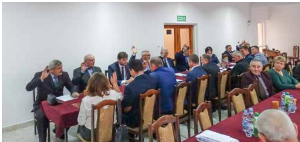
Obrady I sesji Rady Gminy VIII Kadencji, 23.11.2018 r.

W 2019 roku gmina kontynuowała modernizację dróg gminnych, 1,8 km wybudowano w Białopolu, Raciborowicach i Raciborowicach – Kolonii oraz 1 km drogi powiatowej w Teremcu. Na inwestycje drogowe wydatkowano ponad 1mln 119 tys. zł, w tym z budżetu gminy ponad 423,4 tys. zł,