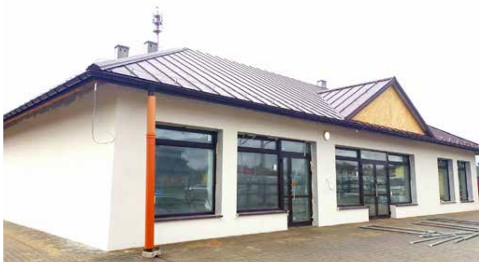
Budowa budynku usługowego w ramach Odnowy Centrum Białopola