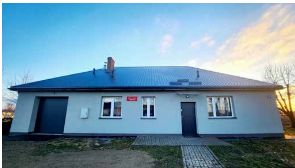
Zmodernizowana świetlica w Strzelcach