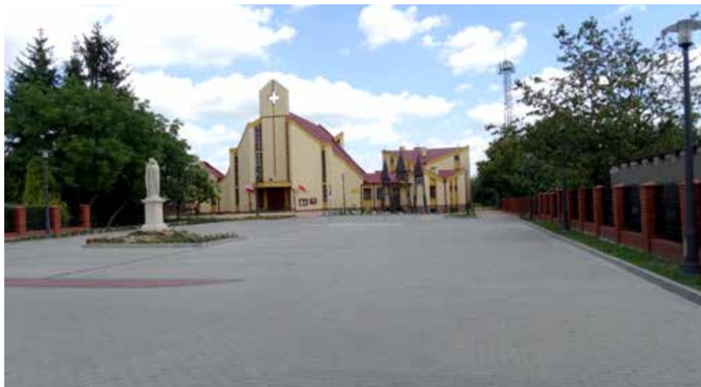
Nowy parking przy Kościele Parafialnym w Białopole, 2017 r.

Ponownie dofinansowano kwotą 35 tys. zł remont zabytkowego kościoła w Parafii Buśno. Ponadto samorząd wsparł organizacyjnie Parafię Białopole, która pozyskała ponad 180 tys. zł na budowę parkingu. Zadanie zostało zrealizowane i rozliczone w 2017 roku.